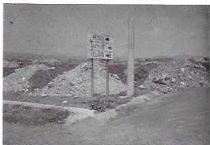
FOTO N° 9 Tiroadero de escombros, que se ha permitido en medir las consecuencias que se tengan en la época de lluvias, ubicado en el lado poniente del Estado Corregidora.

los escurrimientos y que fundamentalmente son los almacenamientos existentes.