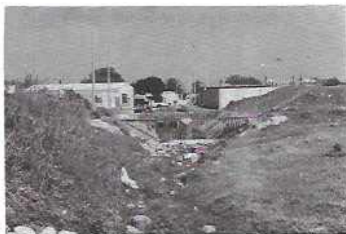
FOTO N° 7-B Estructura de desfogue del vaso regulador, formada por dos tubos de 1.20m. y uno de 0.90m.

Por último y tomando en cuenta todos los almacenamientos existentes en la periferia de la ciudad de Querétaro, así como los que se piensan construir dentro de la cuenca del Río Querétaro, es necesario e impostergable llevar a cabo el manejo de sus cuencas, con acciones de conservación de suelo y agua, con el fin de retener la mayor cantidad de azolve, reducir la velocidad de los es-