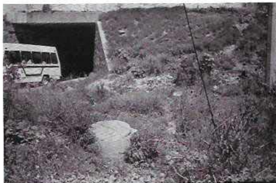
FOTO N° 8 Puente alcantarilla donde actualmente pasan los escurrimientos del arroyo El Tongano, a falta de una estructura de encausamiento al Cimatari I.

Dentro de las medidas estructurales, están las constituidas por la infraestructura hidráulica existente, destinadas al control de